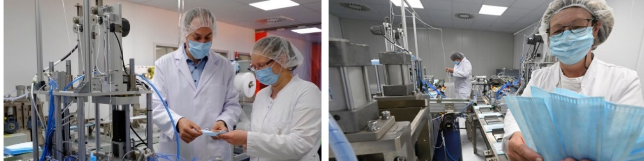
medika Medizintechnik GmbH Hof, am Standort TEG Heinzendorfergrund